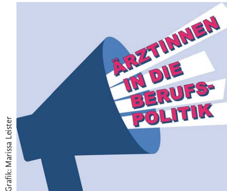
Grafik: Marissa Leister